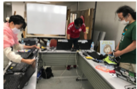
PCセットアップの様子